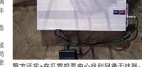
警方证实，在瓜雪投票中心找到网路干扰器。

他在接受《当今大马》电访时说，讯号干扰器为一个铁盒，上有6支天线，以及贴有写着“4G”及“Wifi”的标签，其发现位置在观察员座位底下。