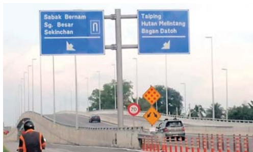
Projek FR5 dijangka dapat merancakkan lagi peluang ekonomi sekali gus meningkatkan hasil pendapatan MDSB pada masa depan.

Jumlah kutipan cukai MDSB dari Januari hingga September 2018 lalu