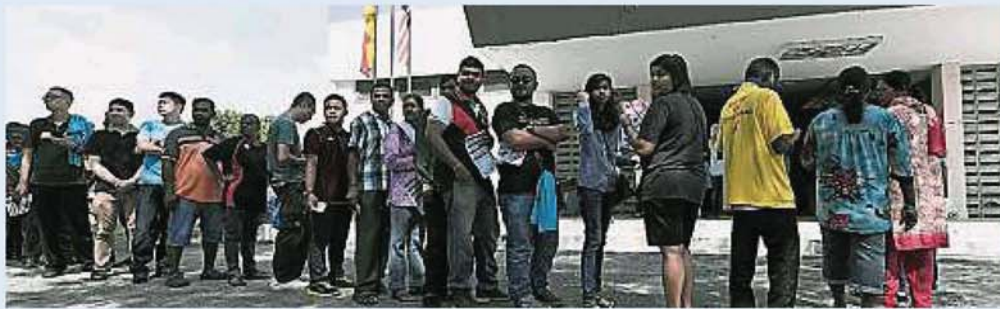
班登区部投票中心延至早上10时40分才开放让党员进入投票，投票时间原定于早上9时。

Provided for client's internal research purposes only. May not be further copied, distributed, sold or published in any form without the prior consent of the copyright owner.