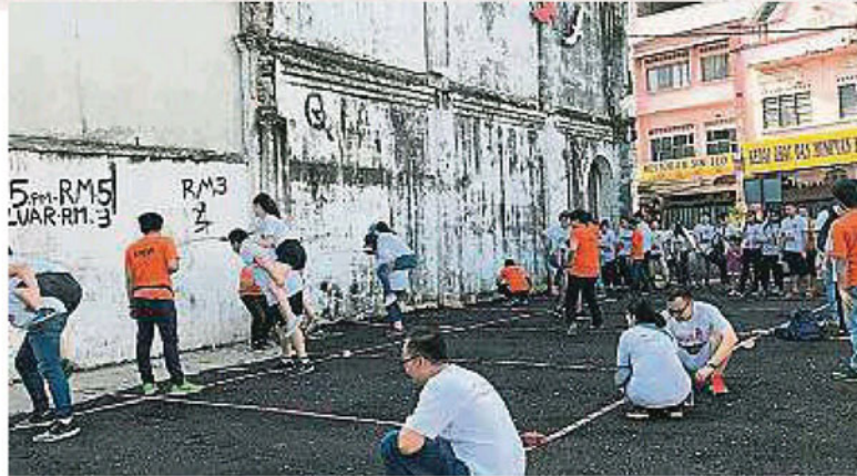
▲参赛者过五关斩六将，使出浑身解术挑战大会所设下的任务。