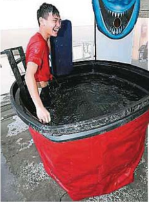
▲配合万圣节的到来，嘉年华现场设有“鬼屋”游戏，让参与者玩得不亦乐乎。