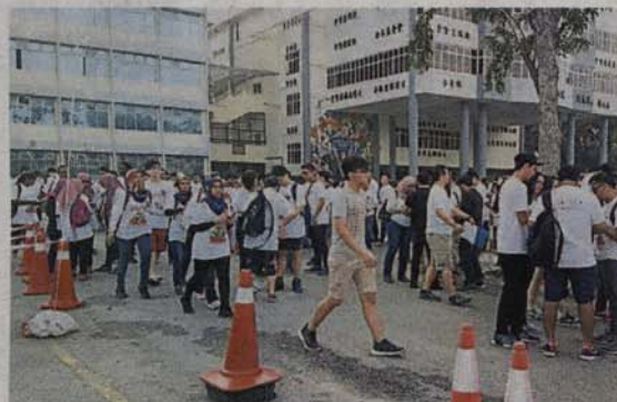
■开幕后，参赛者领取寻宝说明与指示，并与组员讨论再出发“寻宝”。