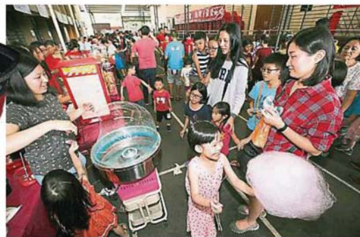
▲新明华小老师、学生、家长及当地居民踊跃出席嘉年华，现场热闹非凡。