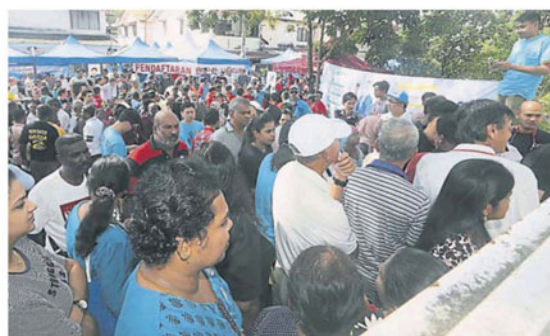
班丹许多党员在上午 9 时已到安邦再也市议会礼堂前，但被迫等待约 2 小时。

在班丹，有不少党员在上午 9 时已到安邦再也市议会礼堂前，但被迫等待约 2 小时，直到上午 10 时 40 分礼堂才开放，引起许多党员愤怒不满。