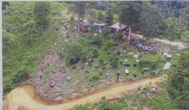
Three shacks with zinc roofing have been built on a hillock off Jalan Rawang where trees were felled.

Gombak is the second district to host the state exco meeting as