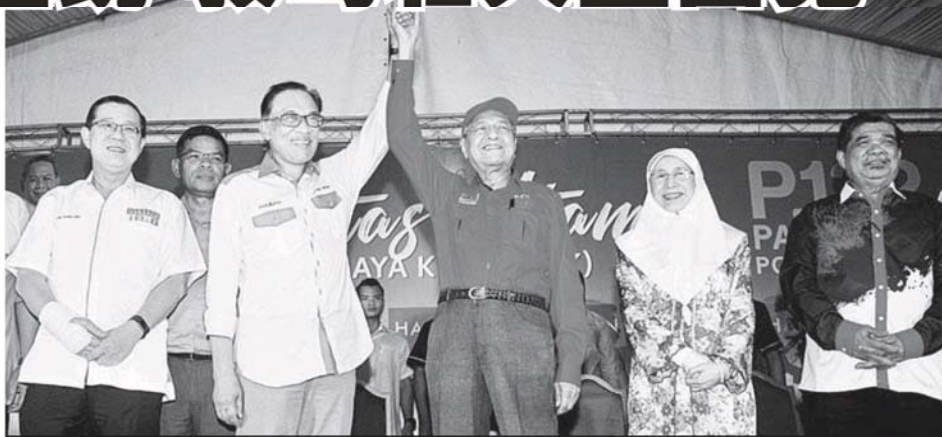
土著团结党若开放让大批巫统领袖加入，或会影响土团党与希盟成员党的稳定关系。图为马哈迪（右3）本月8月在波德申补选时，为安华（左2）站台。左起为林冠英、旺阿兹莎、莫哈末沙布。 -曾钰劭-

他续说，一旦阿末扎希被判罪名成立，无法再担任巫统党主席，就会进一步掀起派系斗争，巫统再也不能作为有建设性的反对党。