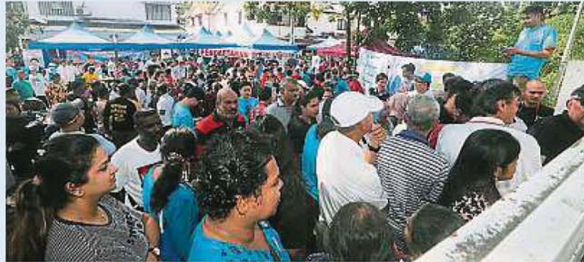
党员从早上9时开始抵达安邦再也市议会礼堂等待投票中心开放。

(吉隆坡28日讯)公正党党选雪州最后一批区部今天投票状况连连，瓜拉雪兰莪区部疑有人破坏而展期，安邦、班登及丹絨加弄3个区部因技术问题推迟投票时间。