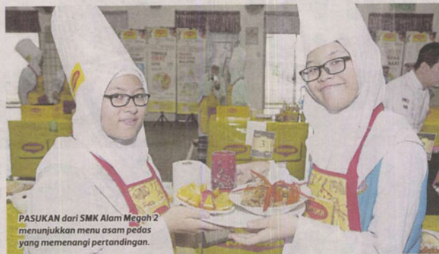
PASUKAN dari SMK Alam Megah 2 menunjukkan menu asam pedas yang memenangi pertandingan.