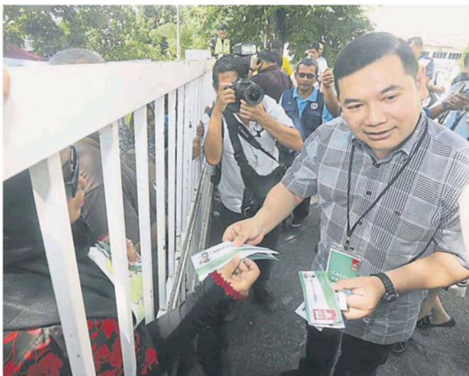
拉菲兹向选委会工作人员展示票根。