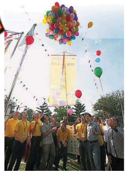
▲众嘉宾为“爱吾新明”嘉年华主持开幕礼。