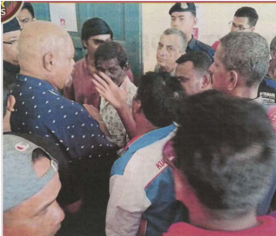
Disgruntled voters voicing their grouses at the PKR polls in Kuala Selangor yesterday.